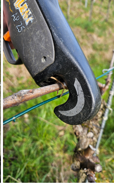
Anbinden der Ruten

Wir blicken auf ein anspruchsvolles, aber trotzdem erfolgreiches Weinjahr 2025 zurück. Die Weiss- und Roséweine sind nach unserer Beurteilung sehr fruchtig, elegant und ausgewogen. Die Rotweine bestechen durch sortentypische, intensive Aromen und einen samtigen, kräftigen Körper.